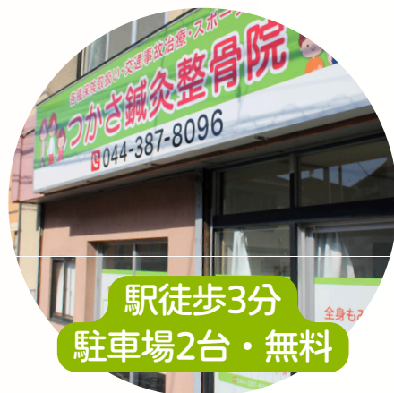
駅徒歩3分 駐車場2台・無料