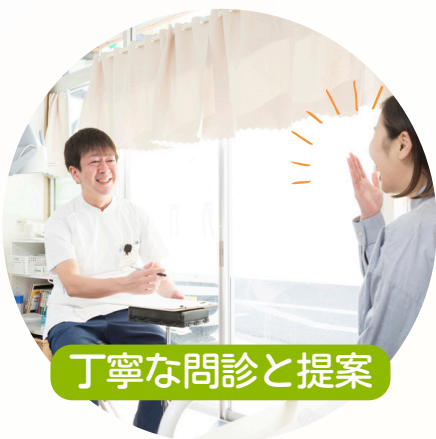
丁寧な問診と提案