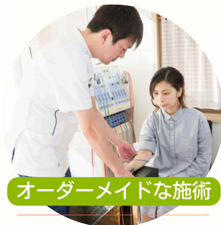
オーダーメイドな施術